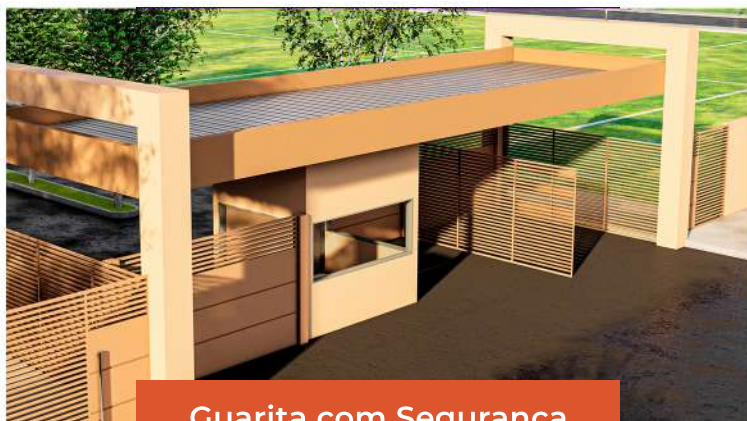
Guarita com Segurança