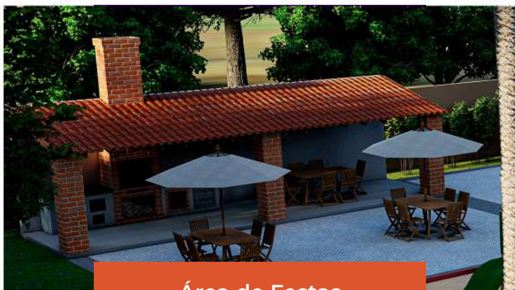
Área de Festas