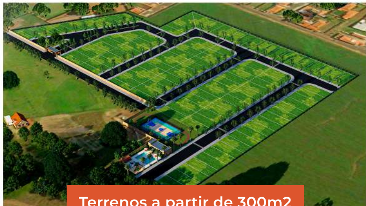
Terrenos a partir de 300m2